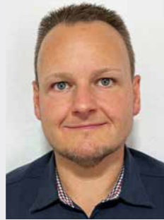
STELLVERTRETENDER GESCHÄFTSFÜHRER/ DEPUTY MANAGING DIRECTOR