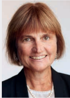
GESCHÄFTSFÜHRERIN/ MANAGING DIRECTOR